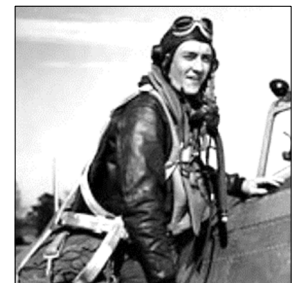
2nd Lieutenant Arthur C. Maul (Bild rechts)

56th F.G. / 61st F.S. / Republic P-47 D-22-RE Thunderbolt / # 42-25836 / Beim Hochziehen nach Tiefangriff auf einen Zug Beschuss durch 2./Flakscheinwerfer-Abteilung 308 (v) -> Stellung 632 - Zusammenstoß in der Luft mit P-47 / Absturz 300 m nördlich Marlers, westlich Poix-de-Picardie (Région Picardie) - Frankreich / 2nd Lieutenant Arthur C. Maul / Gefallen