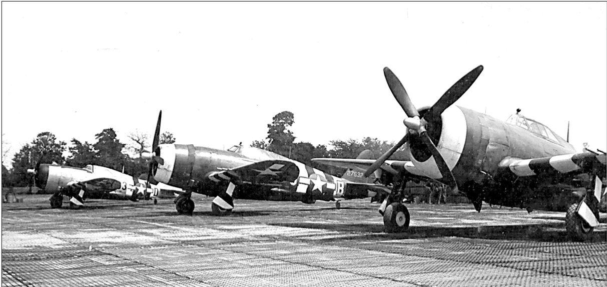
Gegner für Bf 109 des JG 26 sind heute P-47 Thunderbolts der 368th Fighter Group - 9th USAAF (Oben)

11./JG 26 / Messerschmitt Bf 109 G-6 / # 165179 / Gelbe 9 + I / Luftkampf mit P-47 Thunderbolts der 368th Fighter Group - 9th USAAF / Absturz östlich Avranches (Région Basse Normandie) - Frankreich / Obergefreiter Günter Dehsombés / Gefallen