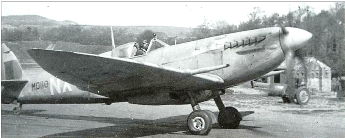
Spitfire der 131. Sqn. auf einem Platz in England (Oben)

7./JG 51 / Focke Wulf Fw 190 A-8 / # 172739 / Blaue 5 + / Luftkampf mit Spitfires der 131. Sqn. / Absturz im Raum Mont-Saint-Jeane, östlich Mayenne (Région Pays-de-la-Loire) - Frankreich / Unteroffizier Hans Hermann / Vermisst